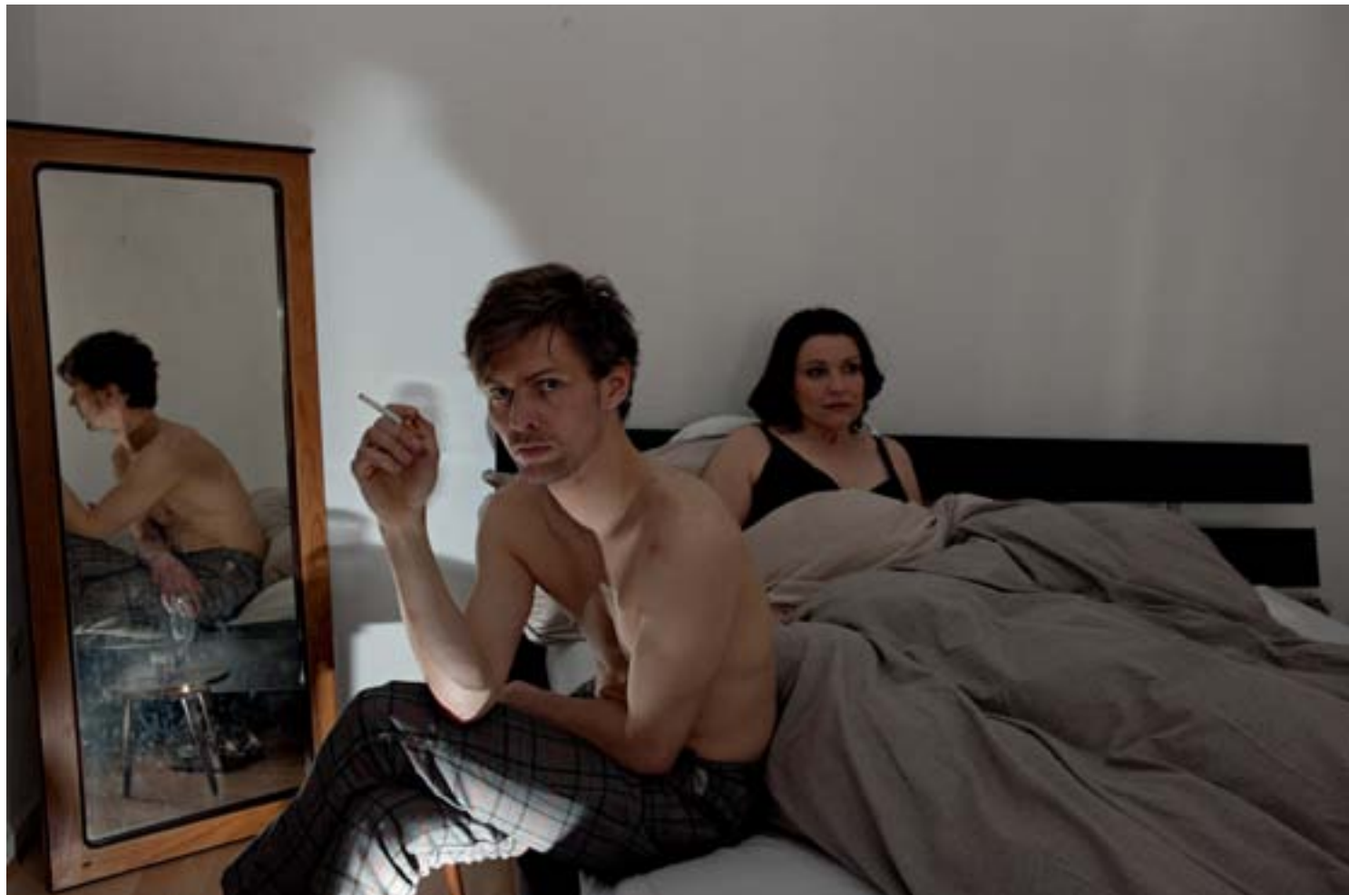
Gerlachstraße 06-04-2011, 13:32