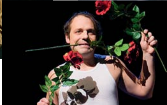
Thomas Hamm Schauspieler

mit dem Bausparvertrag für ein eigenes Haus mit Garten, in dem die Kinder spielen können? Lässt man den heiß begehrten und frühzeitig fürs Kind ergatterten Platz in der Schule einfach sausen, wenn in einer anderen Stadt eine spannende künstlerische Herausforderung lockt?