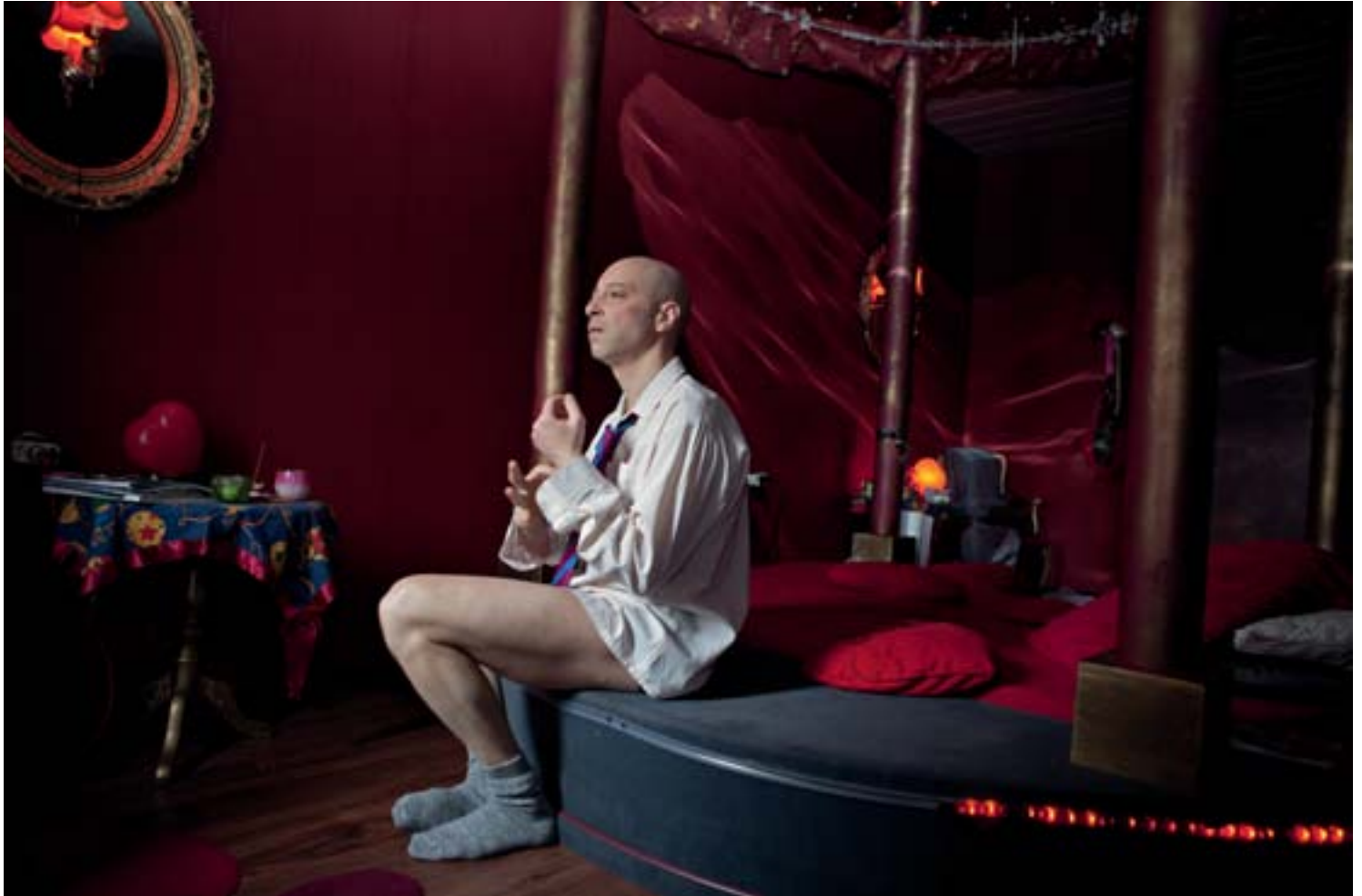
Club Cherie 31-03-2011, 14:00