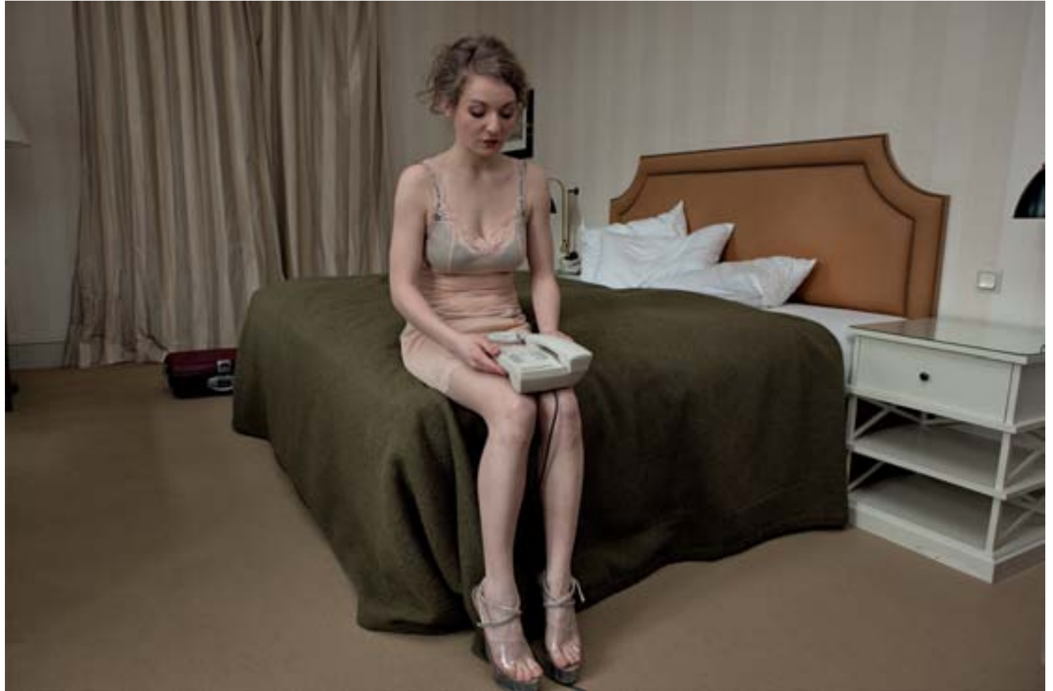
Quellenhof 04-04-2011, 16:19