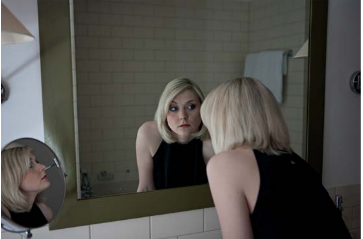
Quellenhof 29-03-2011 – 11:26